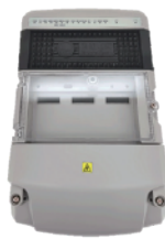
SCU台区智能融合终端本体