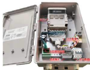
SCU台区智能融合终端内部示意图