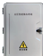
SCU台区智能融合终端外箱

UT-6173 SCU台区智能融合终端是集配电台区供用电信息采集、各采集终端、用电数据收集、设备状态监测及通讯组网、就地化分析决策、协同计算等功能于一体的智能化融合终端设备，可满足一个台区信息采集、管理、上送、交互等功能。